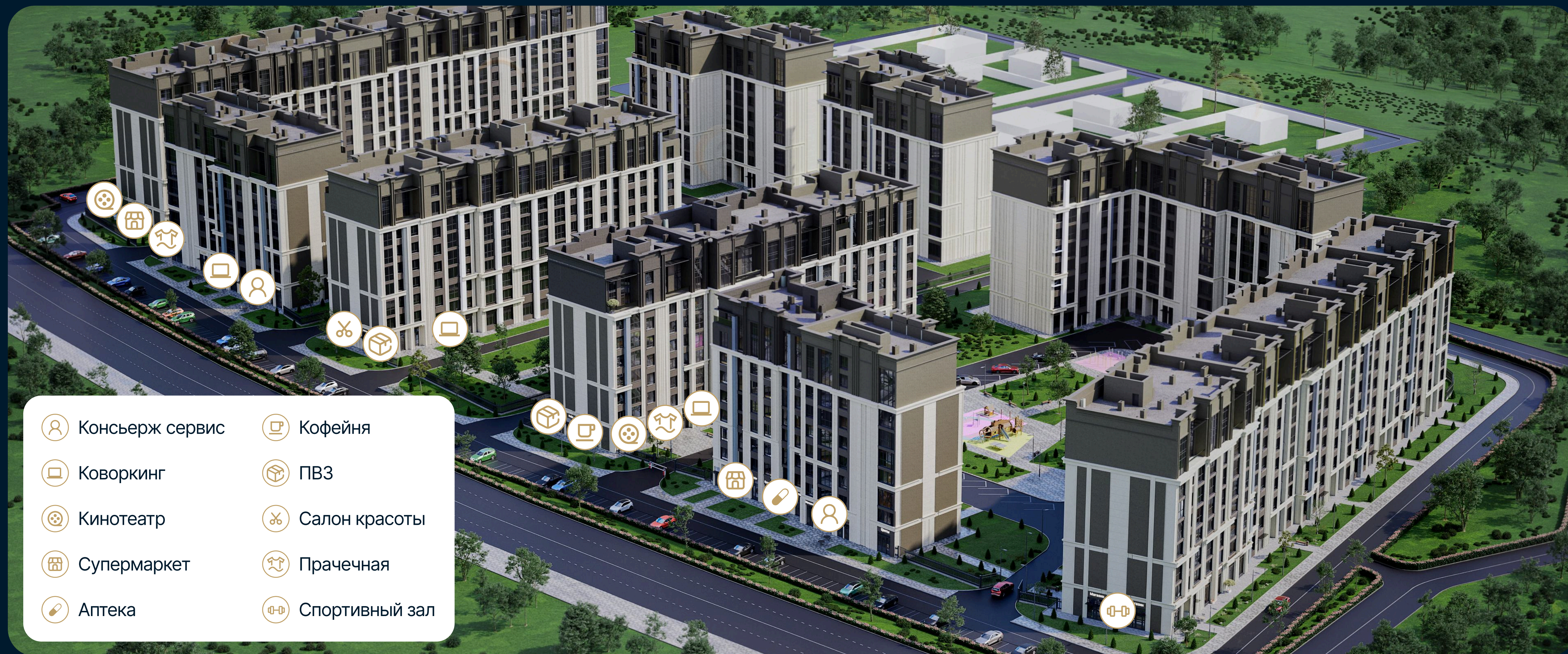
СХЕМА РАЗМЕЩЕНИЯ КОММЕРЧЕСКИХ ПОМЕЩЕНИЙ